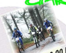
Bici - 10,00 horas