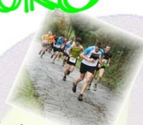
Correr - 10,30 horas